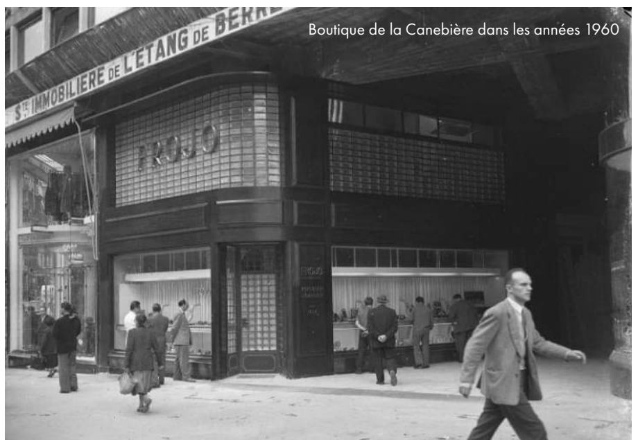
Boutique de la Canebière dans les années 1960