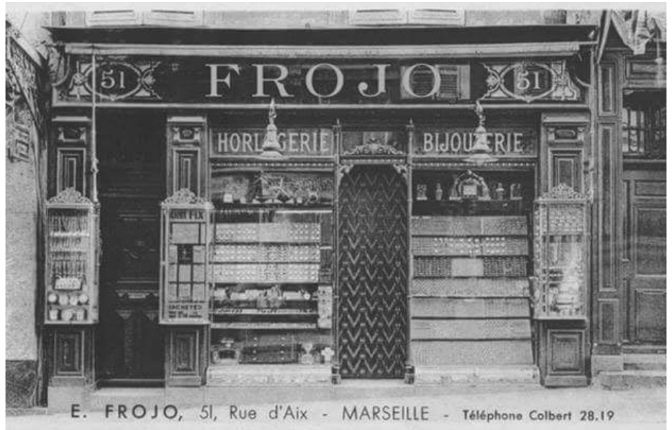
E. FROJO, 51, Rue d'Aix - MARSEILLE - Téléphone Colbert 28.19